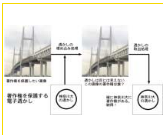
電子透かしの原理